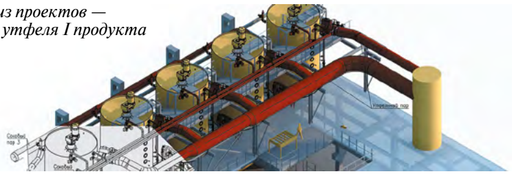
Рендер одного из проектов — участок варки утфеля I продукта

проектов строительства сахарных заводов в СНГ, а также локальными проектами на рынке Российской Федерации, среди которых разработка рабочей документации для трубопроводов продуктового отделения ООО «Промсахар», наладка технологического режима варки утфеля на Жердевском и Сергачском сахарных заводах, разработка проектной и рабочей документации для реконструкции моечного отделения на одном из заводов страны.