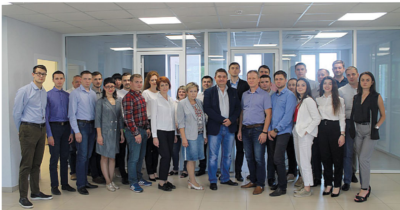
Большая часть команды ООО «Вестерос» в новом офисе в центре Воронежа

С этой точки зрения очень своевременным оказалось появление на российском рынке новой инжиниринговой компании «Вестерос». Более 40 инженеров и тех-