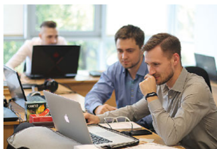
Специалисты архитектурно-строительного отдела

Технологи компании «Вестерос» известны на многих заводах России и СНГ. Пусконаладка